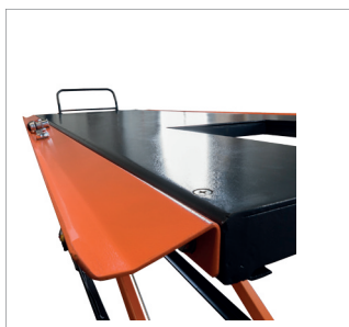
Werkzeugablage Tool trays

Uni → Workshop equipment → Lifts → Lifting platforms motorcycle & scooter → 700 kg → JMP