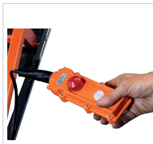
Handfernbedienung. Handheld remote control.