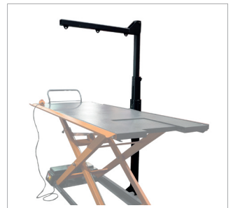
Kran, optional. Crane, optional.