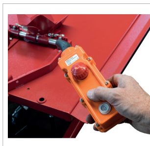
Handfernbedienung. Handheld remote control.