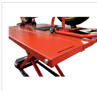
Verbreiterung, optional. Extensions, optional.