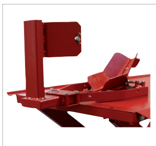
Radhalter, optional. Wheel holder, optional.

📺 In Uni you will also find an application video.